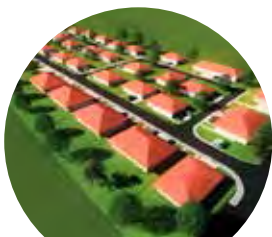
56 rodinných domov HVIEZDOSLAVOV