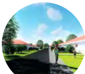
jednopodlažné RODINNÉ DOMY

SPOLU VYTVORÍME ELEGANTNÝ SPÔSOB AKO MÔŽU VAŠE PENIAZE NADŠTANDARDNE A BEZPEČNE ZARÁBAŤ